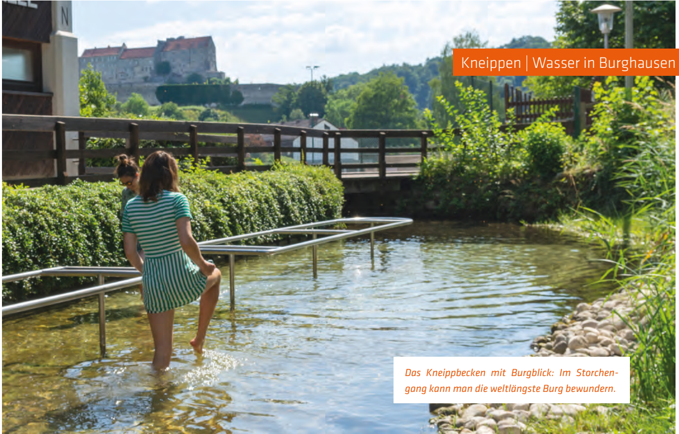
Das Kneippbecken mit Burgblick: Im Storchengang kann man die weltlängste Burg bewundern.