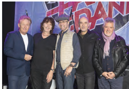
Die Münchener Freiheit rockt am 30. Juli gemeinsam mit der Spider Murphy Gang den Waffenplatz.