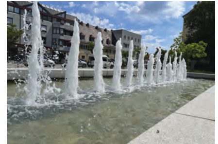
Der Brunnen vor der Johannes-Hess-Schule ist viel mehr ein Wasserspiel, das zum Verweilen einlädt.