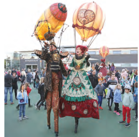
Artisten, Stelzengeher, Clowns und Musiker beleben Alt- und Neustadt

Ort: Altstadt und rund um die Markler Straße und Robert-Koch-Straße