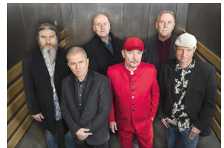
Die Spider Murphy Gang gibt ein Doppelkonzert mit der legendären Münchener Freiheit.