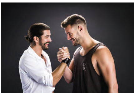
Pizzera & Jaus sind echte Chartstürmer und singen im österreichischen Dialekt.