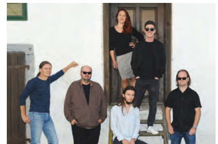
The Badrock Blues Band aus dem Innviertel präsentieren alte Blues- und Rock 'n' Roll-Songs.