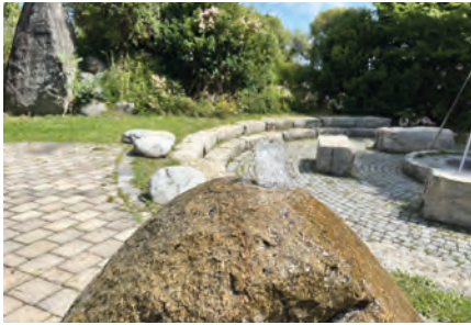
Das Wasser sprudelt aus dem Fels und zwar am Burghauser Grillplatz.