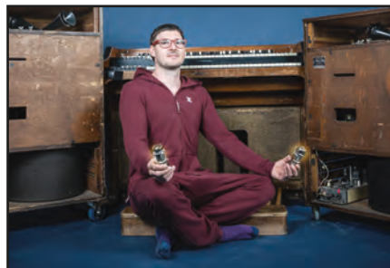
Hattori Hanzı: Die Lead Stimme trägt in dieser Band eine original Hammond Orgel aus den 50ern.