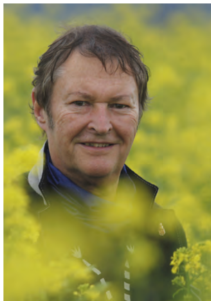
Haindling ist wie Burghausen: Immer einen Besuch wert!