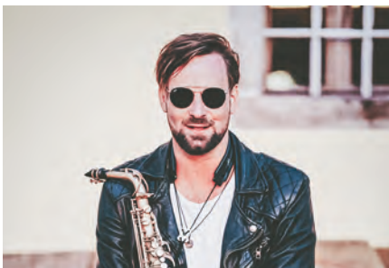
„Max the Sax“ ist am 11. August 2022 am Stadtplatz live zu erleben.

Alle Informationen finden Sie unter www.b-jazz.com .