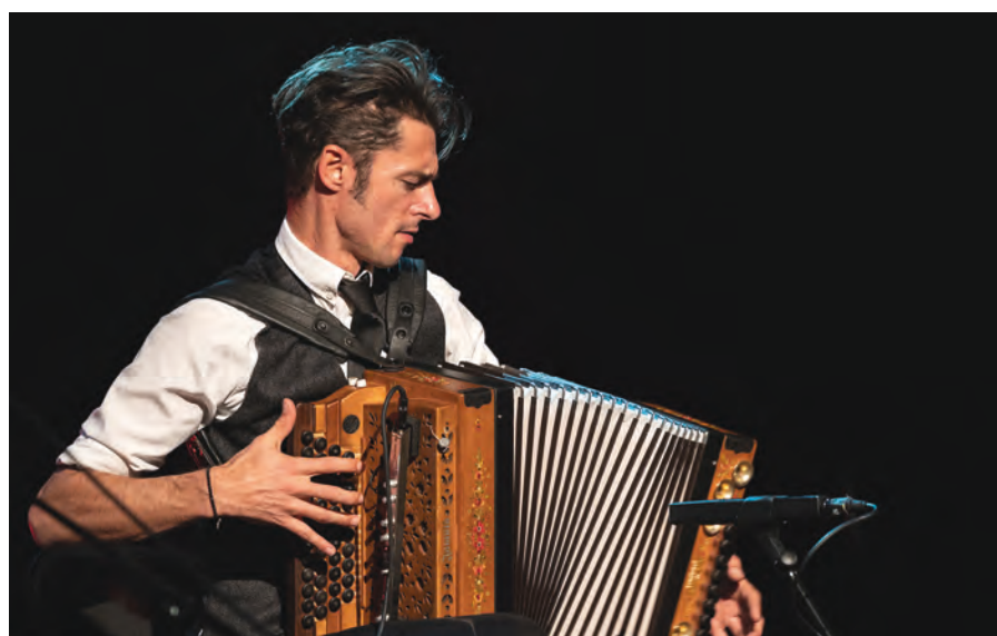
links: Herbert Pixner wird am 1. und 2. August 2022 seine Fans auf der weltlängsten Burg begeistern.