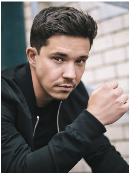
Für seine Sommerkonzerte lässt sich Nico Santos etwas Besonderes für seine Fans einfallen. Lassen Sie sich überraschen!