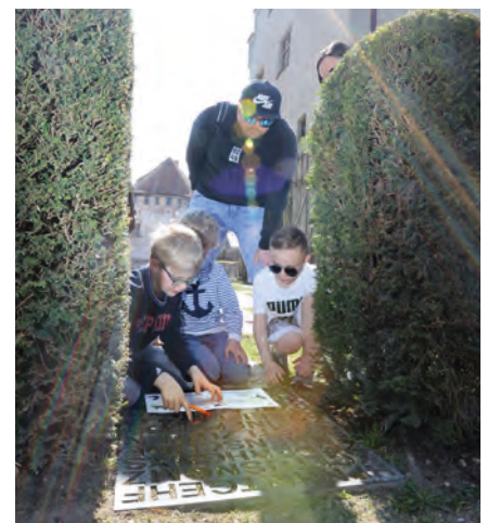
Schnitzeljagd auf der weltlängsten Burg für Kinder von 8 bis 12 Jahren.