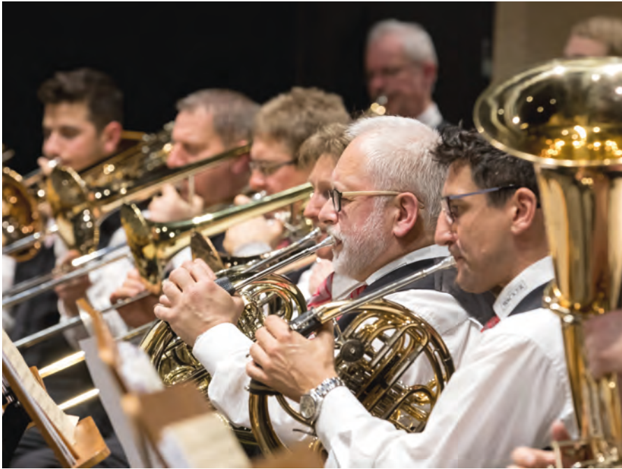
Die Konzerte der Wacker Werkkapelle bereichern die städtische Kultur.